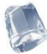
18 gr FULL ICE CUBE