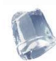
18 gr FULL ICE CUBE