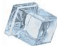
6 / 10 / 17 gr SQUARED ICE CUBE 10 gr.= Standard